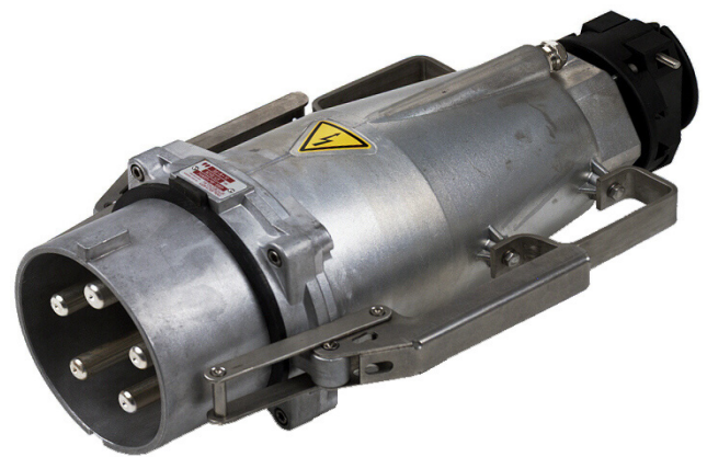
250 / 400 A